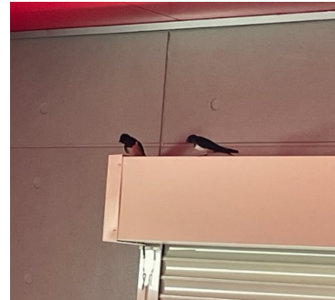
我が家に今年もツバメさん♪

また先日、社内の健康診断にも行って来ました。年々身長が低くなる事と、それに反比例して体重が増える不思議な現象を毎年感じ、採血では平気な顔をしつつ、心の中ではビビりながら無事終わりました～そして本当に怖いのが結果ですね・・・( _ _ ) ;)