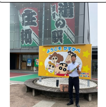
野菜も新鮮! ツバメも元気! 最高です!