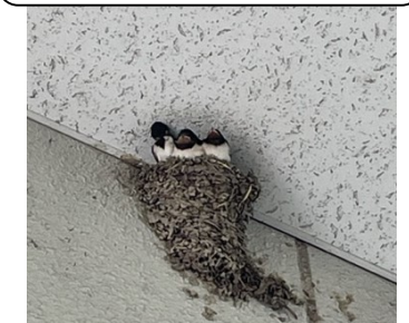
こちらは成長したツバメ達 間もなく巣立ちかな～♪